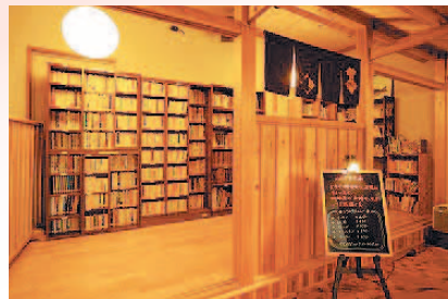
〈おくつろぎコーナー〉

気軽に読書ができるように本棚に様々な本を揃えています。ラウンジにて穏やかな読書タイムをお過ごしください。